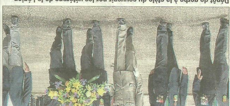
Depôt de gerbe à la stèle du souvenir par les vétérans de la Légion.

Le dépôt de gerbe à la stèle du souvenir par les vétérans de la Légion.