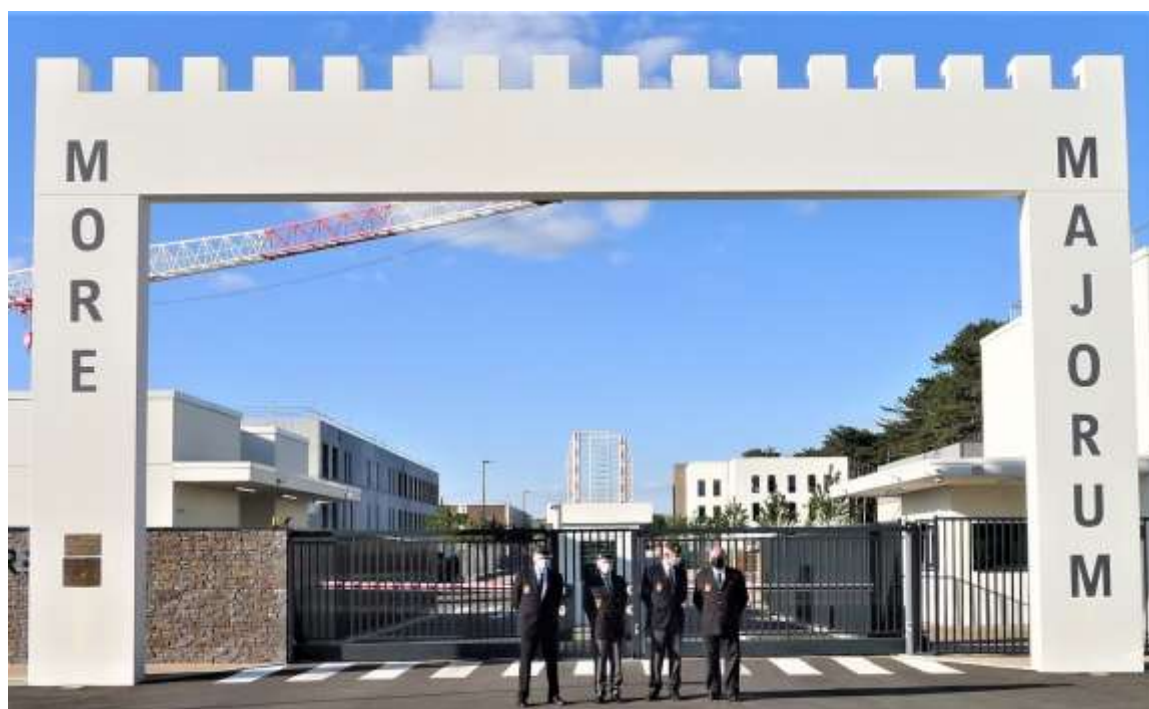
La porte d'Ali Sabieh reconstituée, devoir de mémoire oblige...