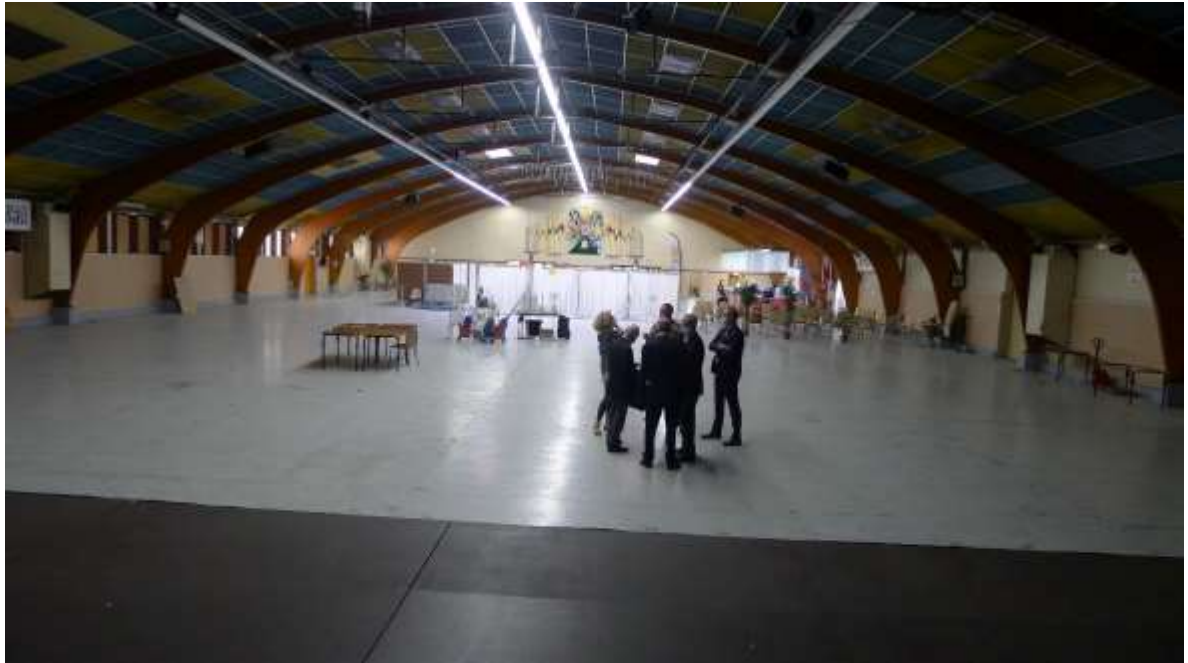
Salle des fêtes de la Mairie