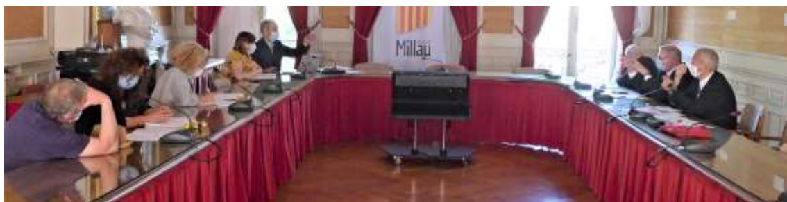
Salle de réunion de la Mairie

Le lendemain était consacré aux contacts avec la mairie de Millau et aux reconnaissances des différents lieux et salles utiles.