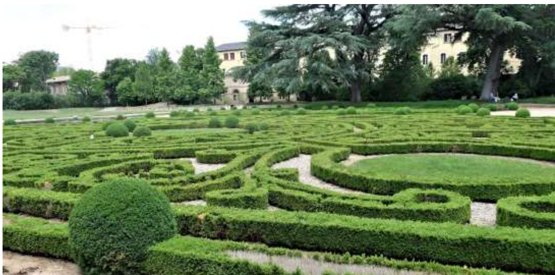
Possibilité du concert de la Musique de la Légion dans un cadre somptueux