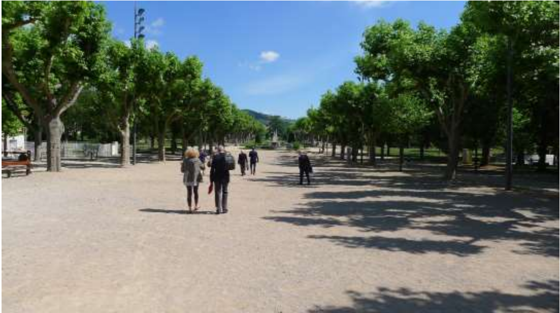
Emplacement Prise d'Armes